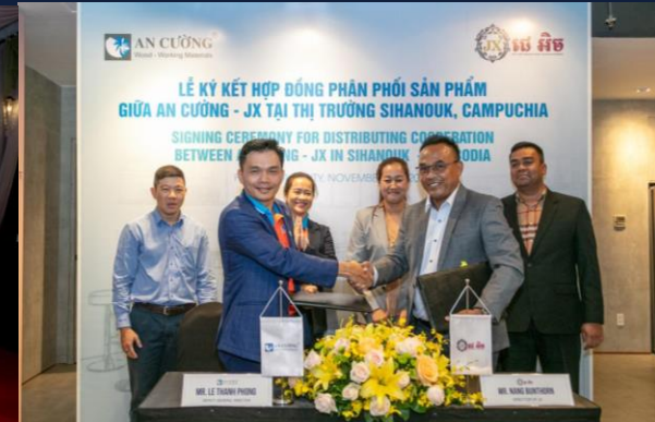
Thỏa thuận phân phối sản phẩm tại thị trường Campuchia