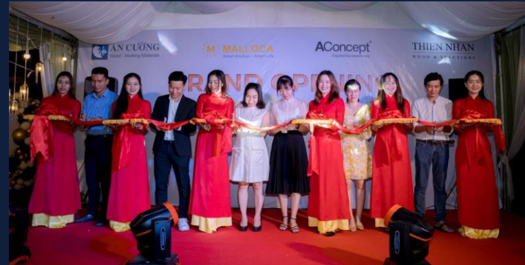
Showroom mới tại Kiên Giang

Trong tháng vừa qua An Cường tiếp tục kế hoạch mở rộng hệ thống showroom và trung tâm phân phối khắp cả nước và ở thị trường Campuchia.